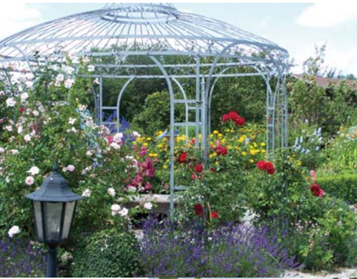
Aus dem Vereinsgarten