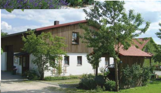
Vereinsheim mit Obstverwertungsanlage